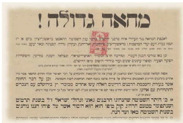
Protest Against Hetter Mekhira, 1910

The obligation today [of Shemittah] stems from the power of the institution of those who came from exile in the days of Ezra and accepted upon themselves to observe Shemittah, despite the fact that there is no Yovel. Therefore Shemittah is not rabbinic, but rather words of tradition [from Na"kh] of the establishment of Ezra. As it is said there (Neh. 10:1-32) "And yet for all this we make a sure covenant, and subscribe it; and our princes, our Levites, and our priests, [set their seal unto it.]...and entered into a curse, and into an oath, [to walk in God's law, which was given by Moses the servant of God, and to observe and do all the commandments of the LORD our Lord, and His ordinances and His statutes]... and that we would forego the seventh year, and the exaction of every debt." Behold, all those who emerged from exile accepted with an oath to keep Shemittah... And certainly this has the legal stringency of a biblical prohibition, like a matter of tradition [from Na"kh], and like the law of a communal oath for all generations. And there is no more room to be lenient on this than in the time of the Temple.